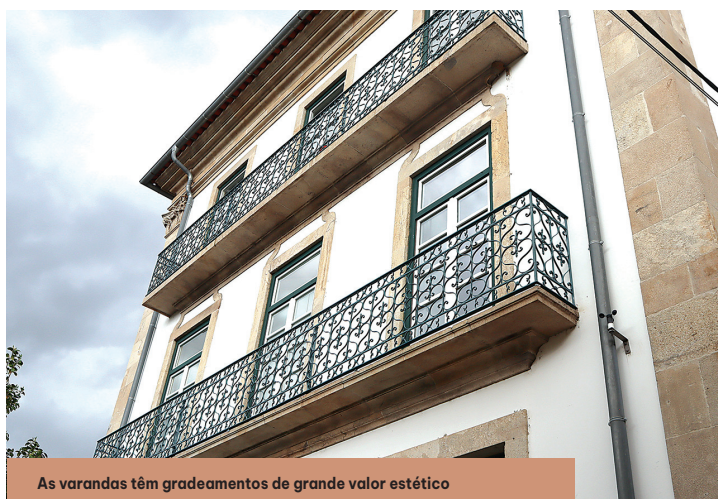
As varandas têm gradeamentos de grande valor estético

Neste momento, na Casa do Loreto estão instalados todo o executivo da Câmara de Monção, os serviços mais centrais da autarquia, incluindo o Gabinete de Atendimento ao Município. Neste edifício merecem um olhar atento os gradeamentos das varandas.