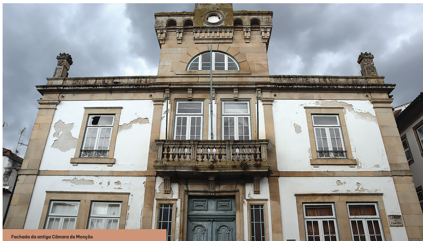
Fachada da antiga Câmara de Monção

A primeira aconteceu no século XVII e a notícia da intervenção é-nos dada na dis-