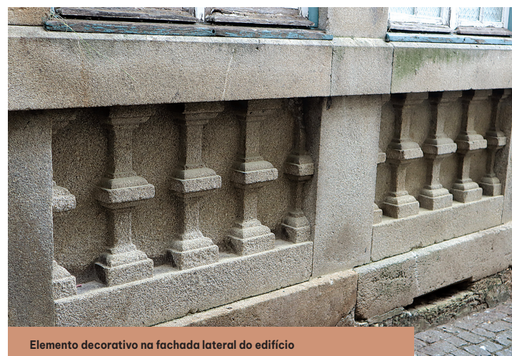
Elemento decorativo na fachada lateral do edifício