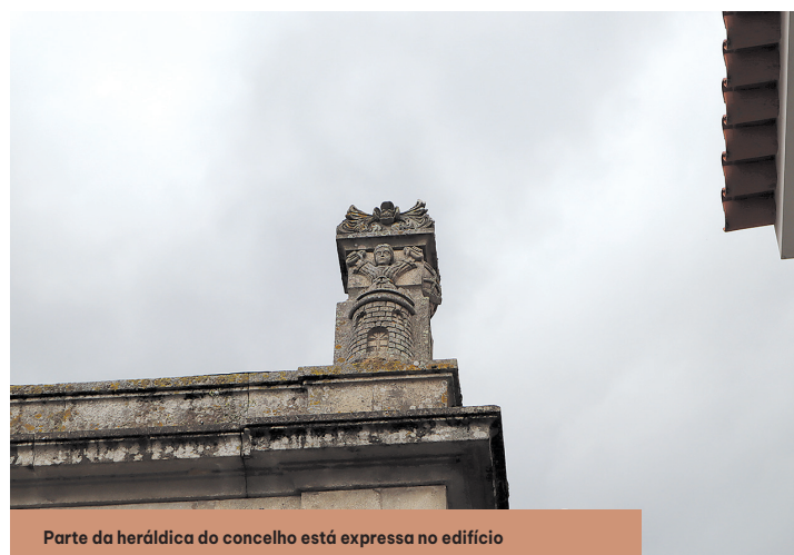
Parte da heráldica do concelho está expressa no edifício

Foram estas obras que deram o aspeto que a antiga Câmara de Monção possui atualmente.