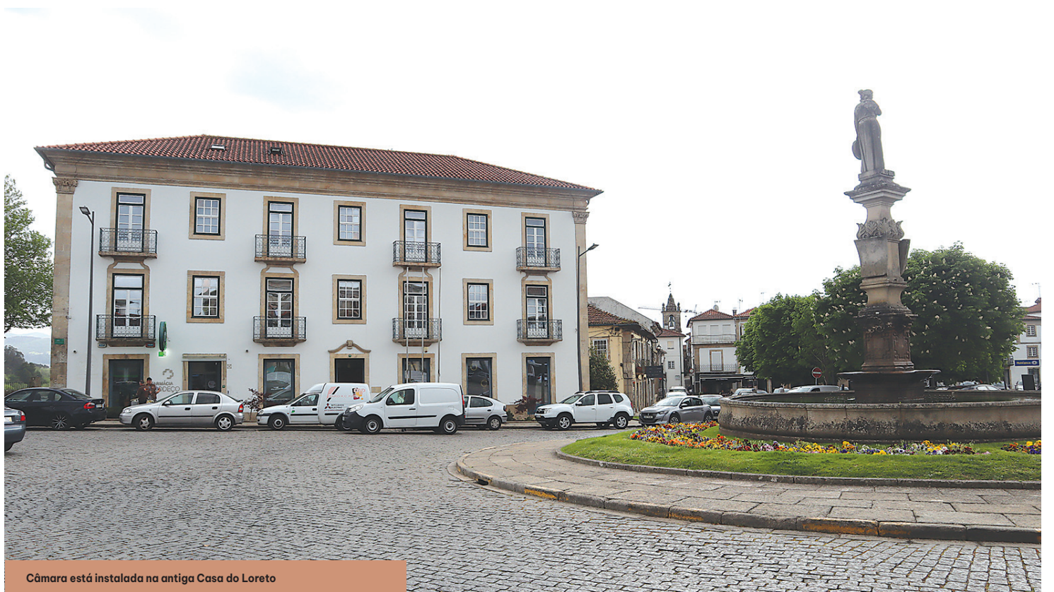
Câmara está instalada na antiga Casa do Loreto

Mas, esta casa, na sua origem, foi uma residência de um particular, não se sabendo nem quem a construiu, nem quem foram os seus primeiros proprietários. Contudo, sabe-se a razão pela qual esta casa tem o nome de Loreto. «Porque em frente, onde há agora um chafariz, havia uma capela que era a Capela do Loreto. Era uma capela militar. Pelas plantas que nós dispomos da Praça de Monção, aquela capela surge na altura da construção da Fortaleza de Monção, portanto é uma capela militar, e que é demolida nos inícios do século XX. À frente dela estaria o chafariz da Danaide que, na altura era retangular. Ainda existem algumas fotografias antigas e algumas gravuras com estes elementos antigos, quer da capela, quer do chafariz, e com os edifícios, de um lado a que é hoje em dia a Casa do Loreto, e do outro uma residência onde funcionava por baixo, du-