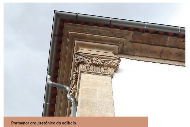
Pormenor arquitetónico do edifício