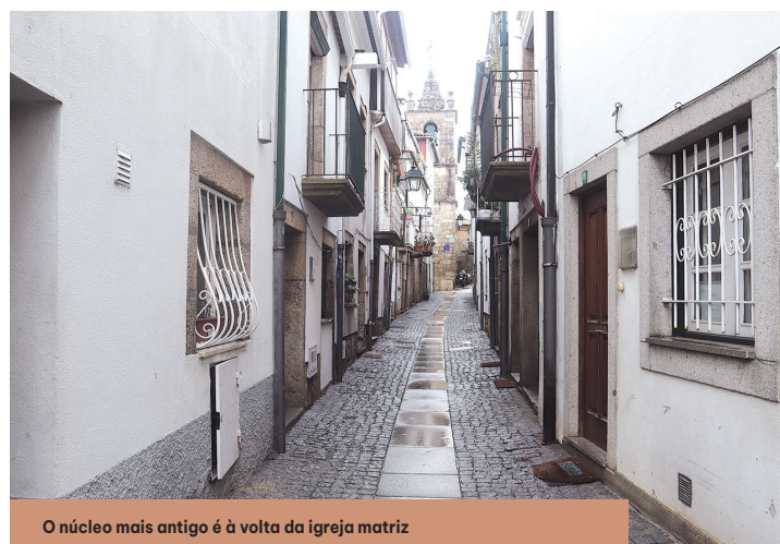
O núcleo mais antigo é à volta da igreja matriz

mentos mais antigos deste centro histórico», questiona. A igreja matriz de Monção é de um românico tardio, com uma capela gótica de grande valor, existem casas quinhentistas, um núcleo da judiaria, casas do século XVII e XVIII condizentes com o fim da guerra e reorganização urbana de Monção. «O que eu gostava mesmo de saber responder é quando é que começou a crescer esta vila medieval», confessa.