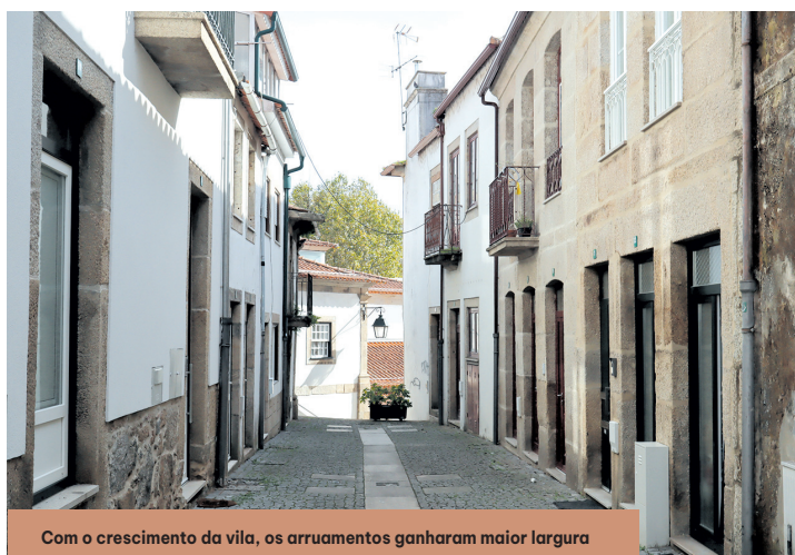
Com o crescimento da vila, os arruamentos ganharam maior largura

arredores no centro da vila, condicionaram a expansão urbana do centro da vila. Na segunda metade do século XIX, beneficiando de algum otimismo económico e da campanha Fontista das obras públicas, bem como de uma estabilidade política, assistiu-se ao desenvolvimento da vila. Já no século XX, pós- 25 de Abril, há obras de reconstrução no núcleo antigo e a expansão da mancha urbanística.