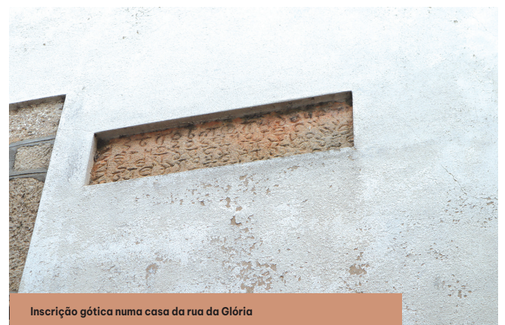
Inscrição gótica numa casa da rua da Glória

tro de Monção, também permite entender a história e a dinâmica deste centro histórico através de algumas informações ali patentes.