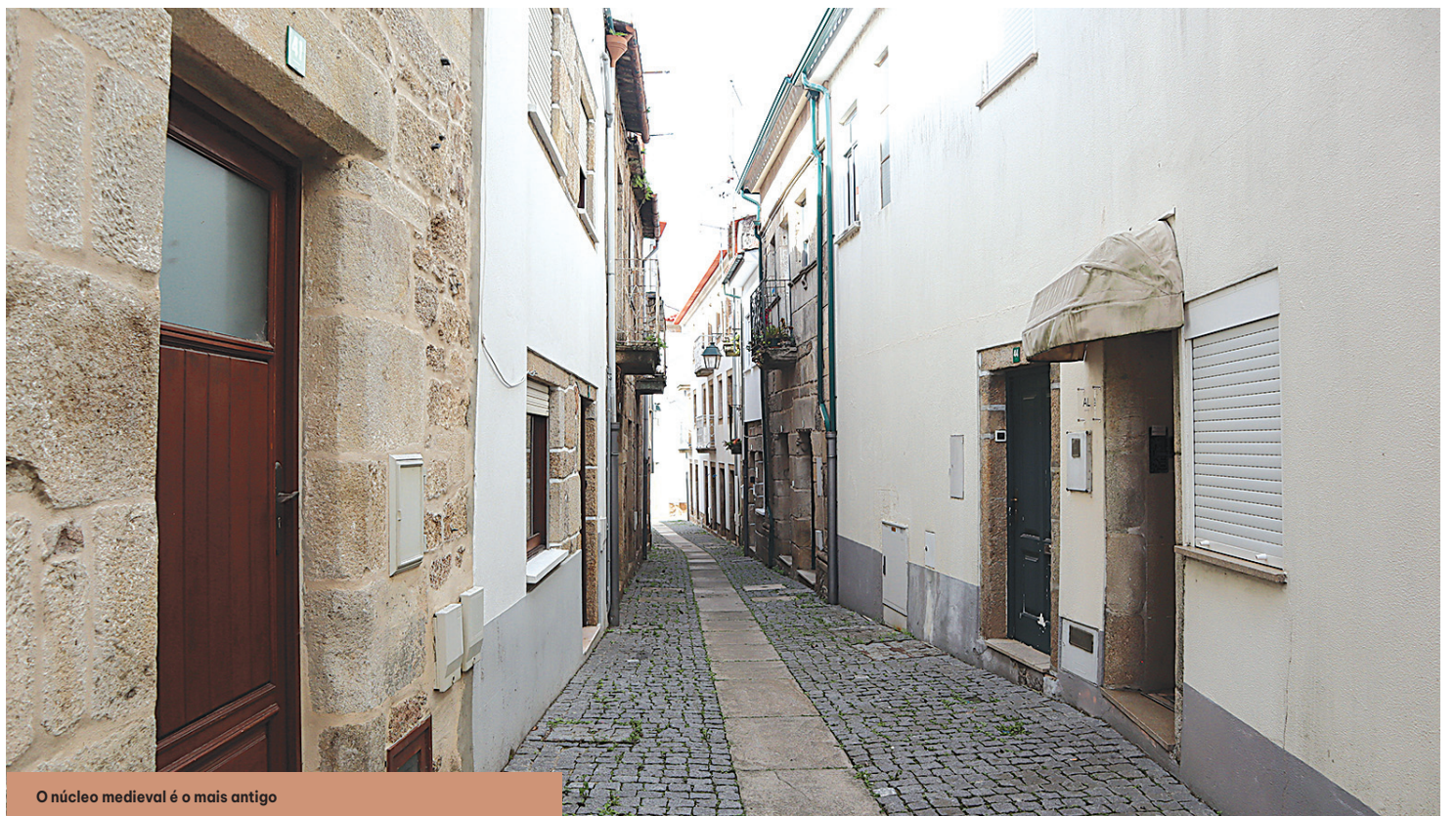
O núcleo medieval é o mais antigo