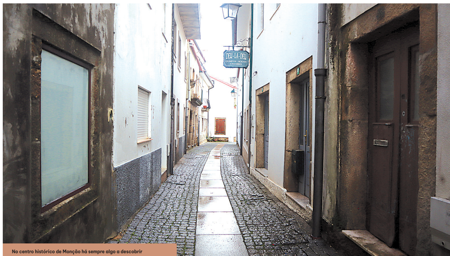
No centro histórico de Monção há sempre algo a descobrir

«Nós, quando olhamos uma e outra e outras tantas vezes para estas casas vamos