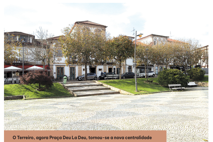
O Terreiro, agora Praça Deu La Deu, tornou-se a nova centralidade