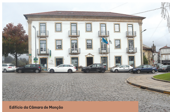
Edifício da Câmara de Monção