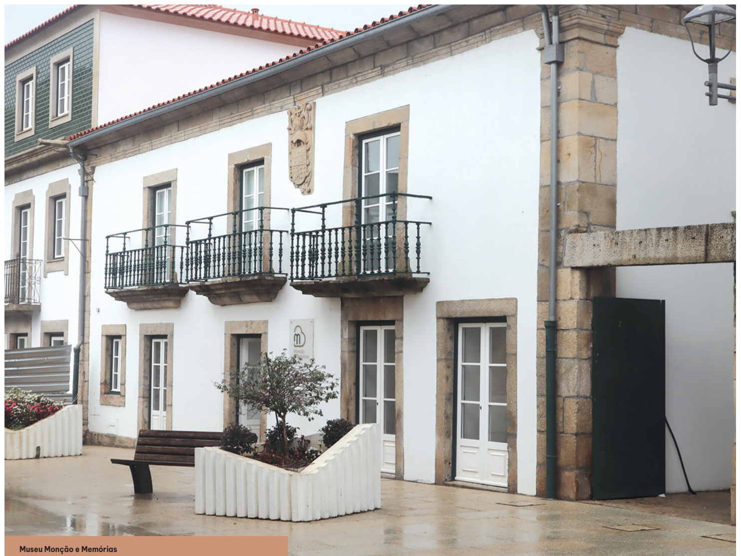
Museu Monção e Memórias

Por outro lado, sublinhou ainda, o Museu Monção e Memórias, situado no cen-