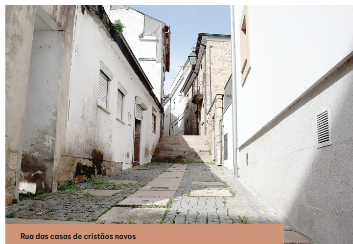
Rua das casas de cristãos novos