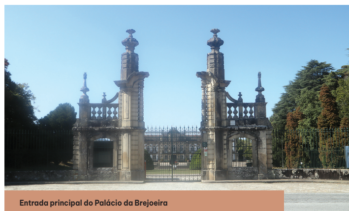
Entrada principal do Palácio da Brejoeira