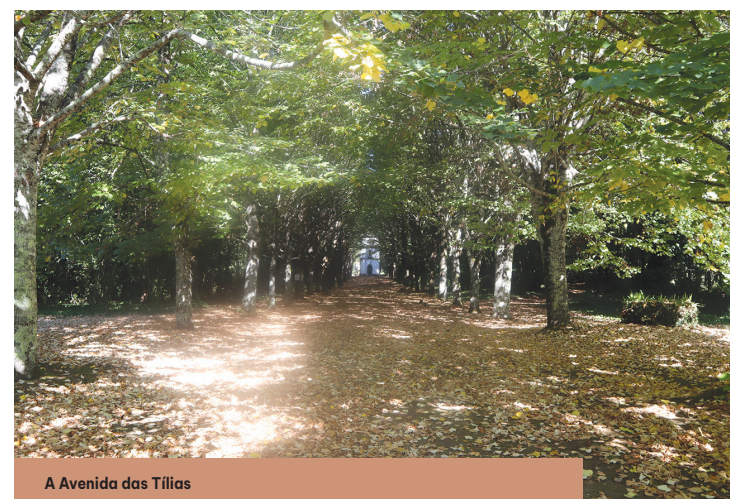
A Avenida das Tílias