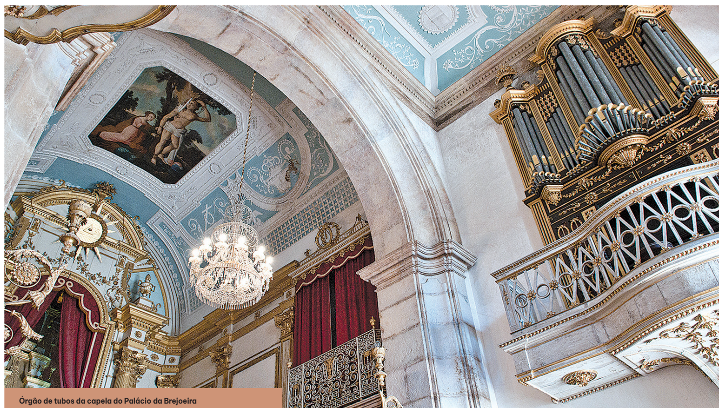
Órgão de tubos da capela do Palácio da Brejoeira

exemplar único na organaria portuguesa, que merece uma atenção especial».