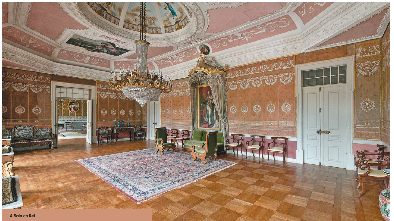
A Sala do Rei

Imponente é a Sala de Jantar, onde decorreu em setembro de 1950 o jantar en-