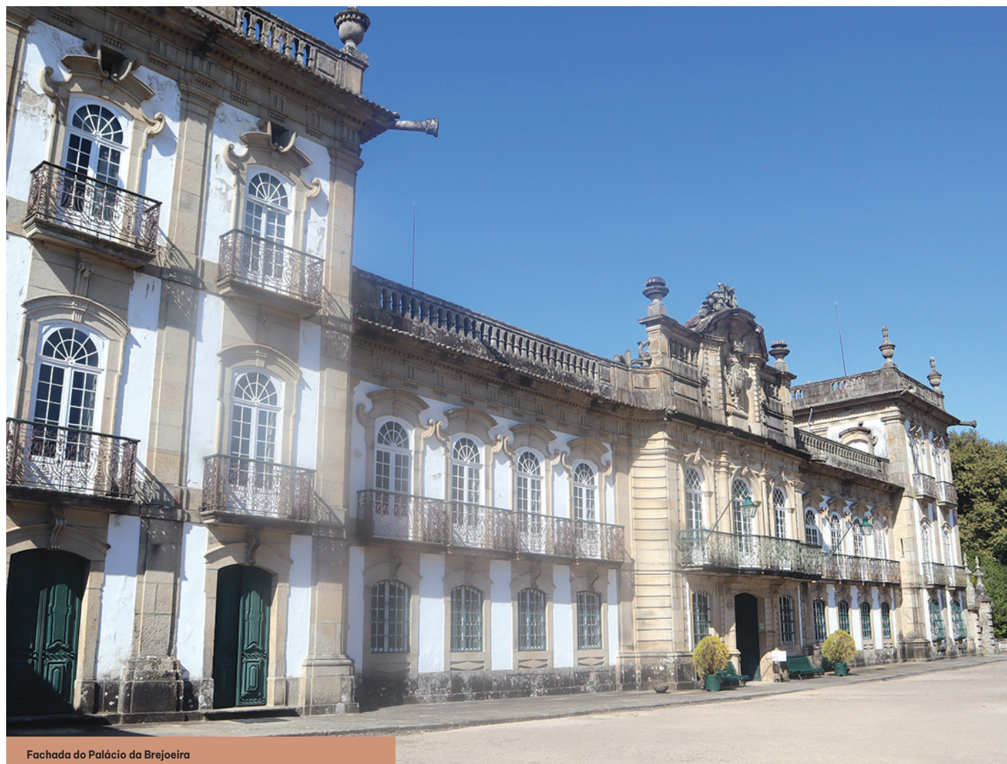
Fachada do Palácio da Brejoeira