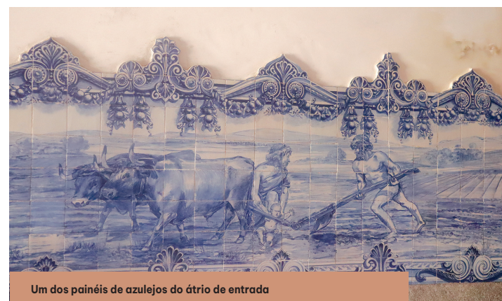
Um dos painéis de azulejos do átrio de entrada

la, o Programa Quinta, composto pelo bosque, as vinhas, o lago e a capela de S. Francisco, ou ainda as Provas de Vinho Alvarinho “Palácio da Brejoeira”, Prova de Aguardente Bagaceira “Palácio da Brejoeira”, ou