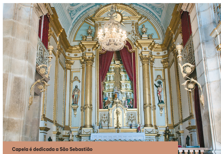
Capela é dedicada a São Sebastião

deiras, num total de quarenta e oito lugares. A caixa de palco, com ponto, é de pequenas dimensões, flanqueada por duas colunas dóricas, tem pintado um bem conservado cenário, com mais de um século, onde se reproduz na perfeição a fachada do palácio. Esta é também uma obra de Pedro Araújo, inaugurada em 1913, no casamento do filho», descreve o historiador na sua obra.