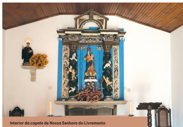
Interior da capela de Nossa Senhora do Livramento