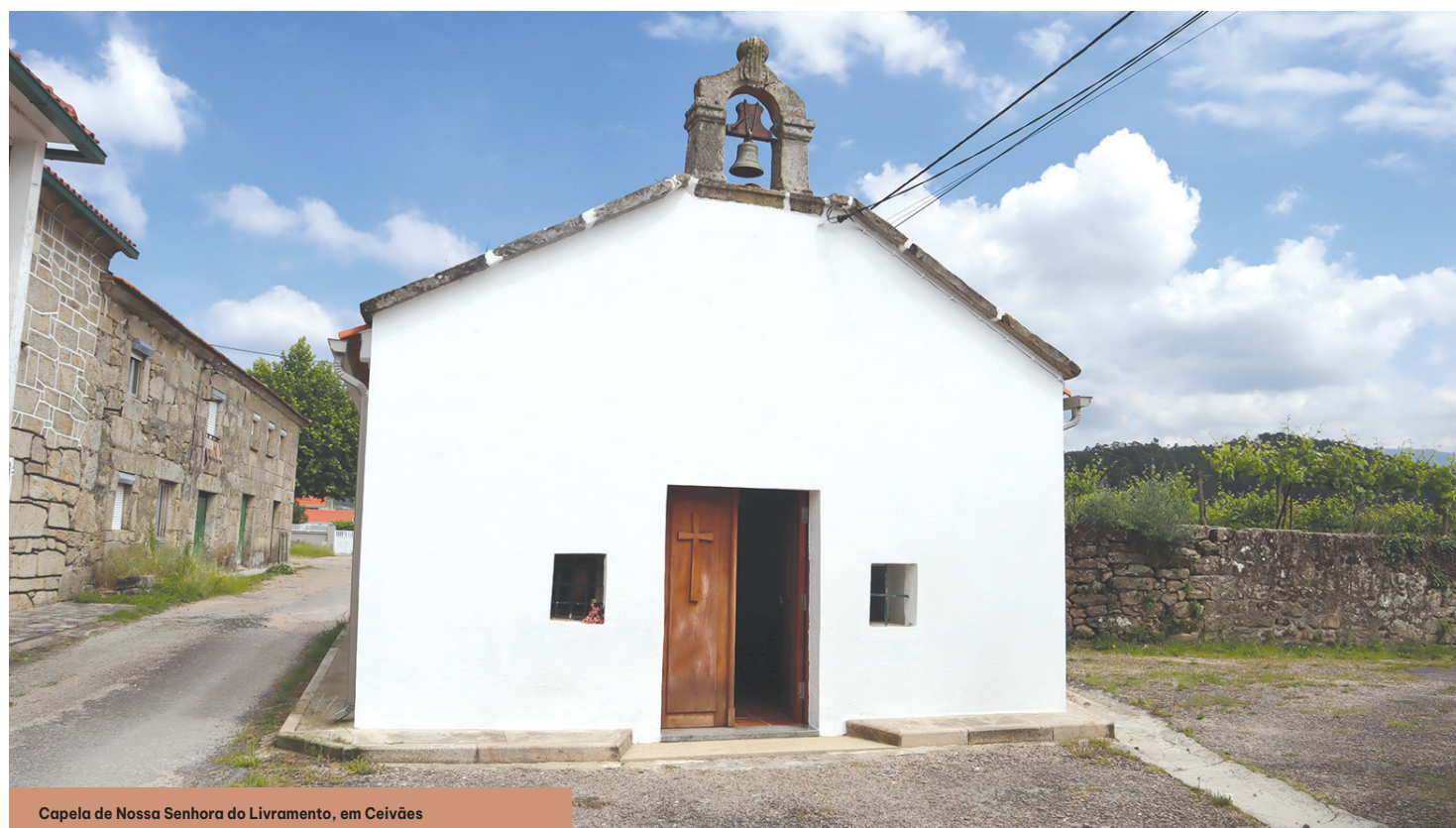
Capela de Nossa Senhora do Livramento, em Ceivães

A fé na Senhora do Livramento, conta a zeladora desta capela, é expressiva nes-