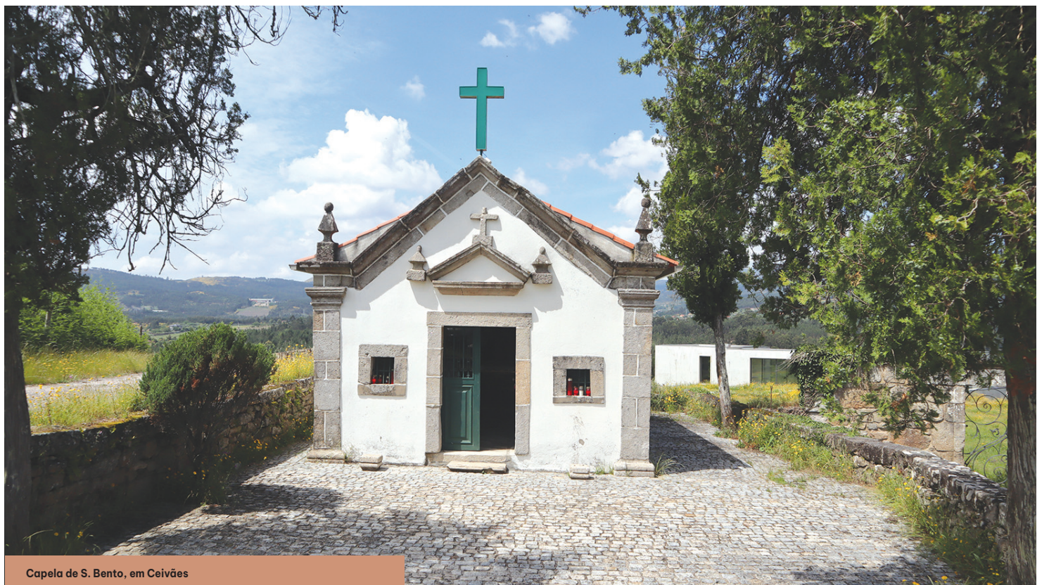
Capela de S. Bento, em Ceivães

A capela de S. Bento, apesar de pequena, tem um grande tesouro no seu interior, que é a talha barroca. O historiador