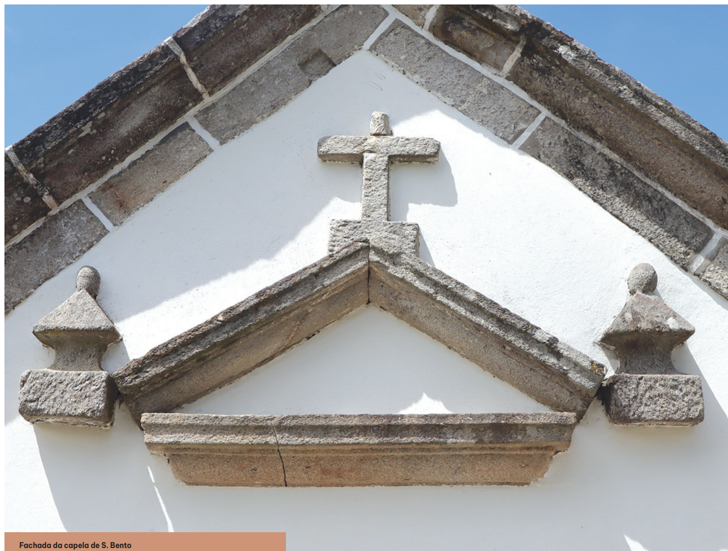
Fachada da capela de S. Bento

A memória do povo retém que este templo, hoje pertencente à paróquia de Ceivães, foi outrora particular. «Esta capela pertenceu ao Conde de Azevedo, pertenciu a esta quinta aqui próxima, a Quinta do Hospital. Os terrenos aqui à volta eram todos da Quinta do Hospital», disse.