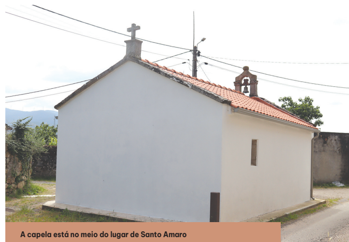
A capela está no meio do lugar de Santo Amaro