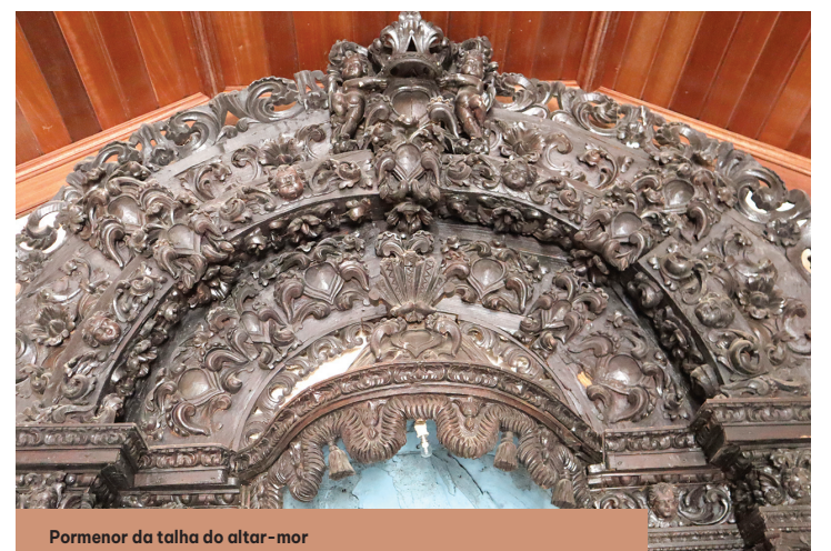
Pormenor da talha do altar-mor