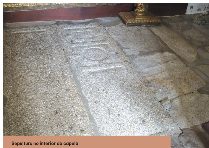
Sepultura no interior da capela