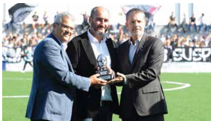
Vitória SC visitou Valença na Taça de Portugal em 2018