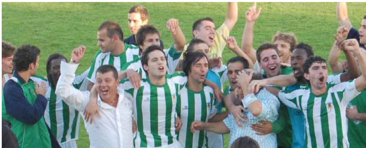
A alegria dos jogadores e dirigentes do SC Valenciano depois de terem eliminado o Olhanense

Na ronda seguinte, foi a vez do Belenenses visitar Valença, na quarta eliminatória, onde venceu por 1-0, com golo de Beto, aos 8 minutos, colocando um ponto final no sonho do SC Valenciano na Taça de Portugal.