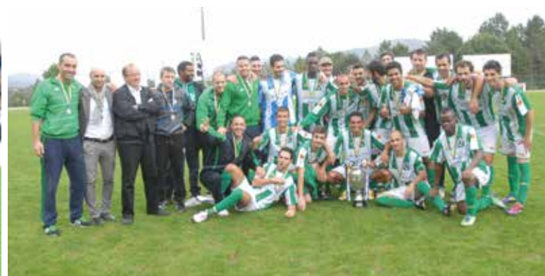
Equipa do SC Valenciano que se sagrou campeã do Minho em 2013