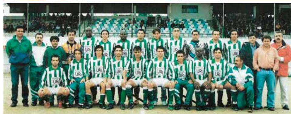
Equipa que subiu à II Divisão Nacional em 1996-97