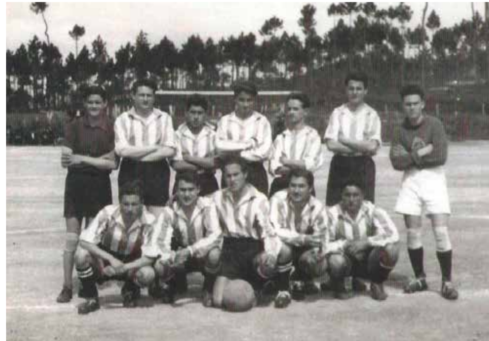
SC Valenciano 1951

O SC Valenciano completa hoje 100 anos de existência, o que faz do clube de Valença o terceiro mais antigo do distrito de Viana do Castelo. A data oficial do nascimento do SC Valenciano é 1 de abril mas o fenómeno desportivo da modalidade que viria a ser conhecida como “Desporto Rei” há muito que encantava a juventude de Valença que tinha rivalidades com grupos da Galiza, nomeadamente da cidade vizinha de Tuí.