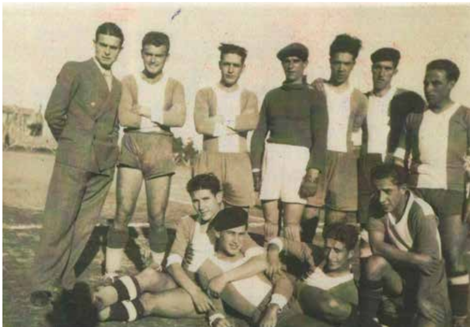
SC Valenciano 1930