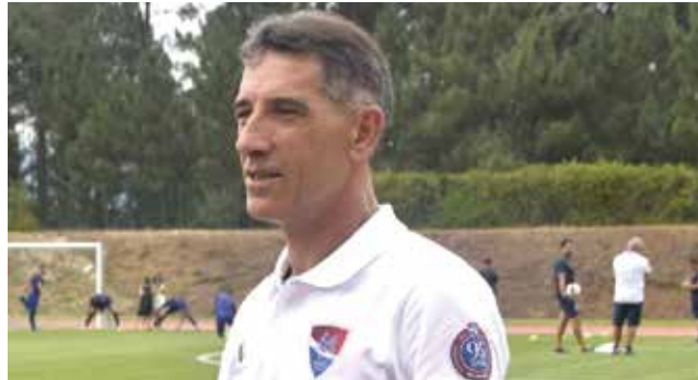
DITO É UMA FIGURA HISTÓRICA DA TURMA BARCELENSE